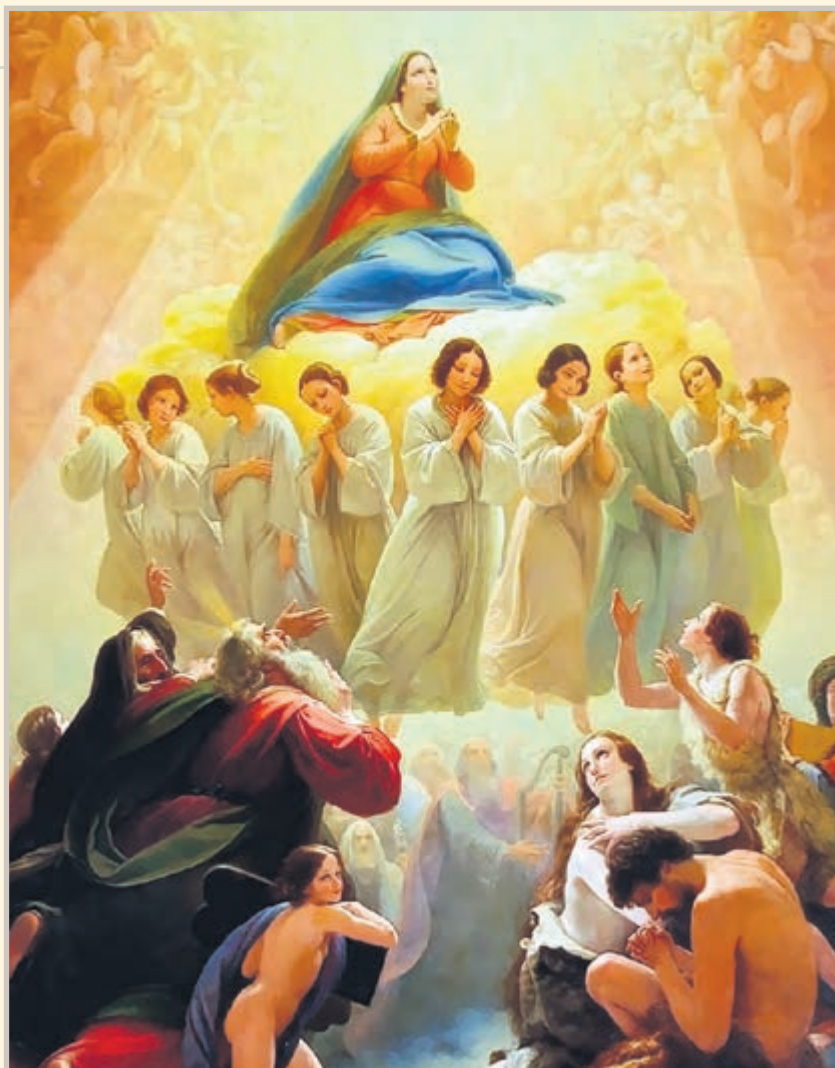
Ilustración: del día martes dedicado a honrar a los santos ángeles. María Santísima, Reina de los ángeles.