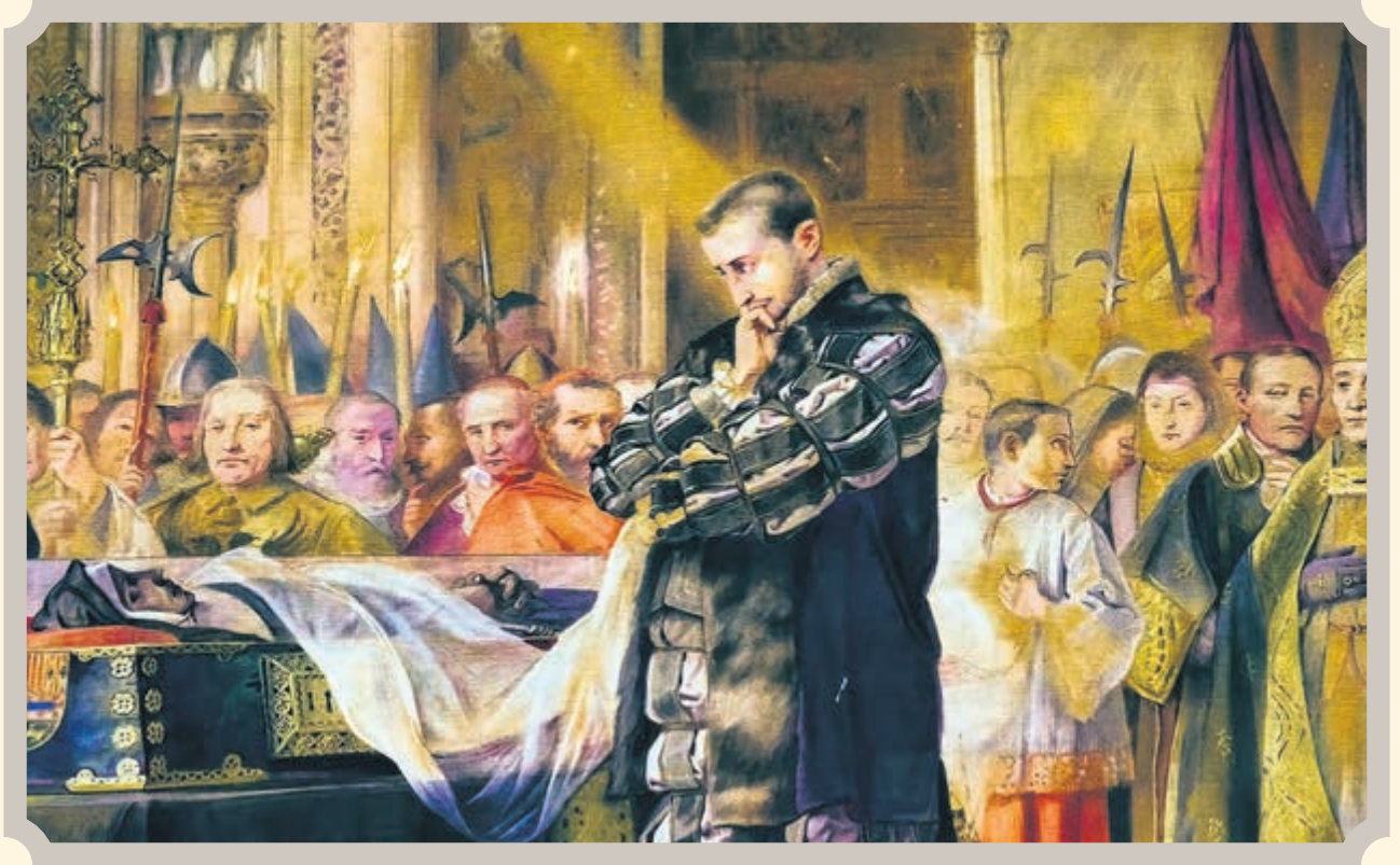
Ilustración: conversión de san Francisco de Borja, otro santo del día.