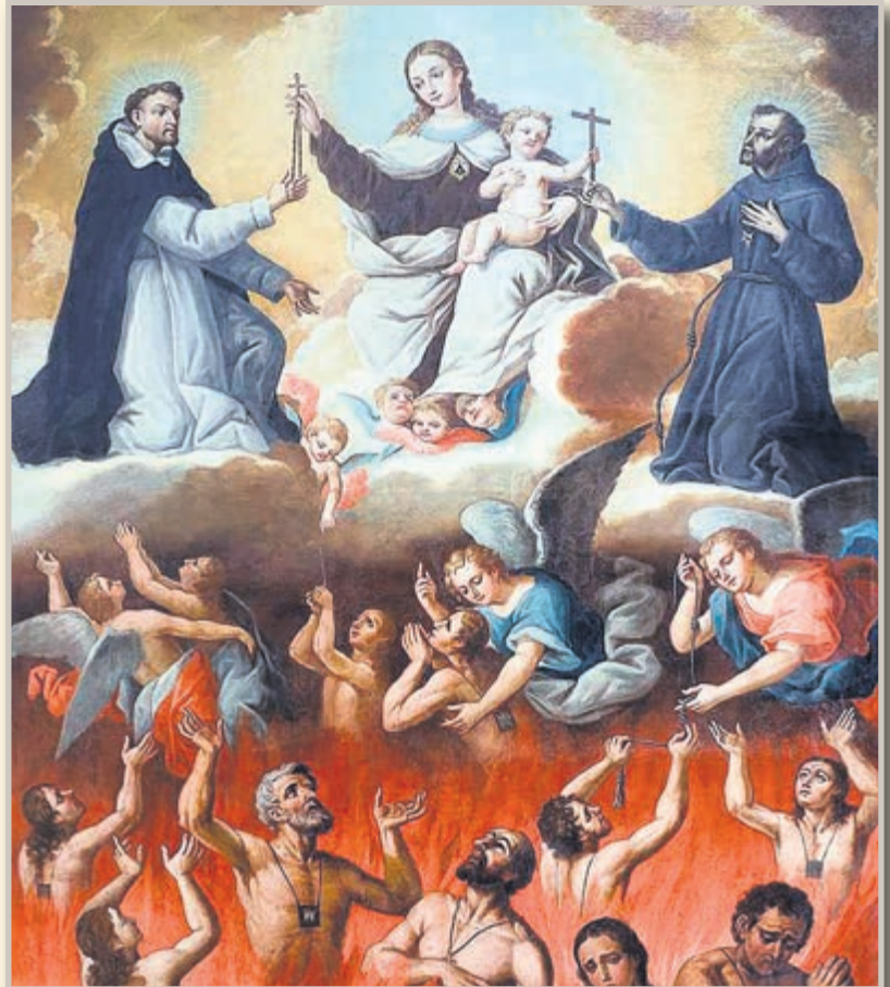
Ilustración: del día lunes dedicado a orar por las almas del Purgatorio. Santo Domingo y san Francisco de Asís intercediendo por las almas del Purgatorio ante el Niño Dios y la Virgen del Carmen.

¡Padre Eterno, Dios soberano! Envía a tus ángeles a librar del Purgatorio a N. , por quien te estoy rogando; te suplico lo llesves a tu gloria, y te pido Señor que lo que aun le falta de satisfacer por sus culpas, le perdones por los méritos de las penas de tu Hijo, Nuestro Señor Jesucristo. Te ruego, oh Padre Misericordioso, no seas riguroso en mi juicio y no nos dejes caer en la tentación, librándonos de todo mal. Amén.