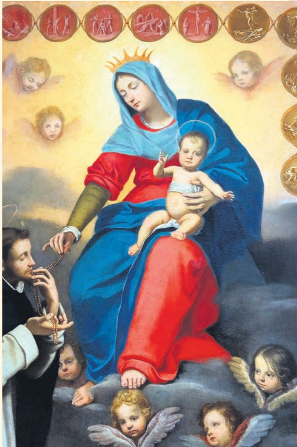
Ilustración: Nuestra Señora del Rosario, otorgando este don a santo Domingo de Guzmán. Obra de Lorenzo Lippi (1658).

“Rezar mi Rosario es mi más dulce ocupación y una verdadera alegría, porque sé que mientras lo rezo estoy hablando con la más amable y generosa de las madres.” San Francisco de Sales