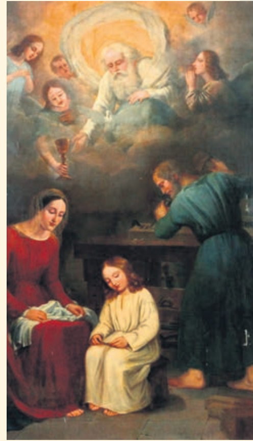
Ilustración: del mes de la familia. “Las dos Trinidades”: del Cielo y de la tierra.

“Instruir a los hijos: esto es, enseñarles a conocer a Dios y a cumplir sus deberes; corregirlos cristianamente, darles buen ejemplo, dirigirlos por el camino que conduce al Cielo, siguiéndolo también vosotros mismos.”