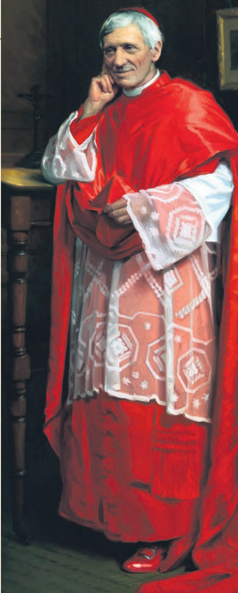
Ilustración: cardenal san John Henry Newman, oratoriano, otro santo del día.

“La fe está fundada en el conocimiento de que Dios es omnipotente; la esperanza lo está en el conocimiento de que Dios es misericordioso.”