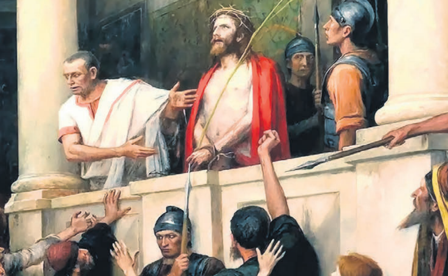
Ilustración: de la Semana Santa, sufrimientos de la Pasión de Cristo. El Señor es condenado por la mayoría.