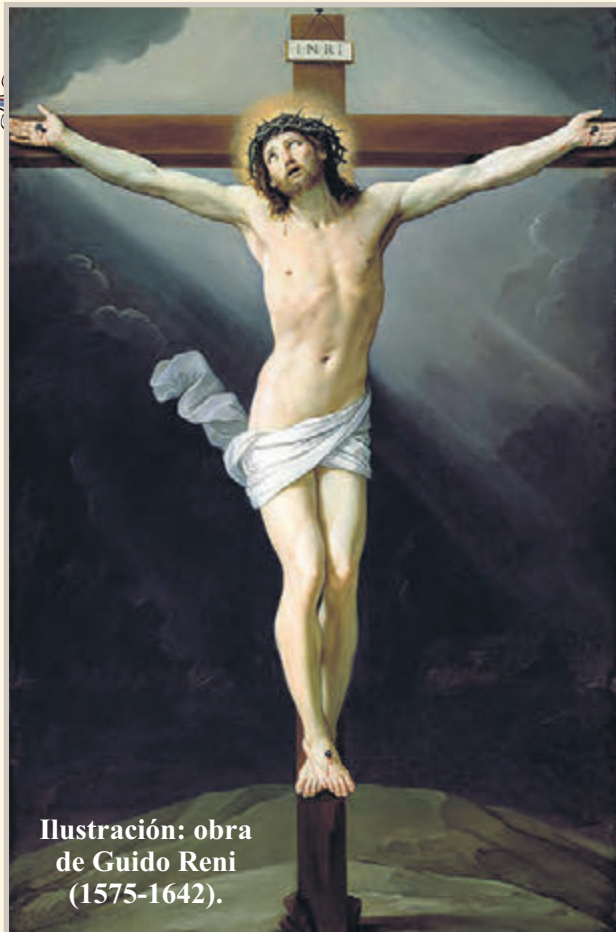
Ilustración: obra de Guido Reni (1575-1642).

En el lugar donde lo crucificaron había una huerta y en ella, una tumba nueva, en la que todavía nadie había sido sepultado. Como era para los judíos el día de la Preparación y el sepulcro estaba cerca, pusie- ron allí a Jesús.