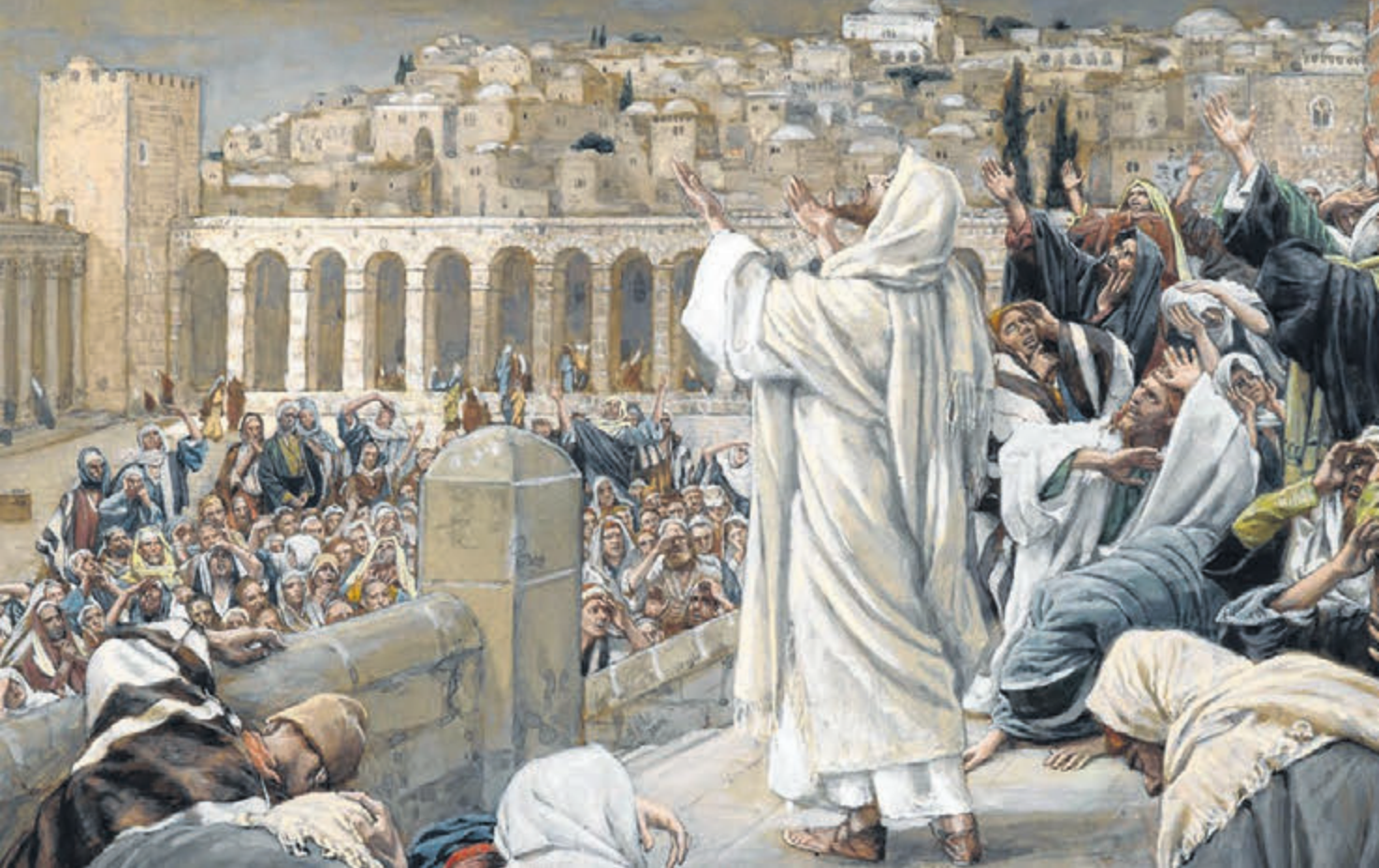
Ilustración: obra de James Jaques-Joseph Tissot (1836-1902).