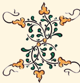
Ilustración: del día viernes dedicado a contemplar y honrar la Pasión de Cristo.

¿Para que los timbres de sangre y nobleza? Nunca los blasones fueron lenitivo para la tristeza de nuestras pasiones. ¡No me des coronas, Señor, de grandeza! ¿Altevez? ¿Honores? Torres ilusorias que el tiempo derrumba. Es coronamiento de todas las glorias un rincón de tumba. ¡No me des siquiera coronas mortuorias! No pido el laurel que nimba al talento, ni las voluptuosas guirnaldas de lujo y alborozamiento. ¡Ni mirtos ni rosas! ¡No me des coronas que se lleva el viento! Yo quiero las joyas de penas divinas que rasga las sienas. Es para las almas que tu predestinas. Sólo Tú la tienes. ¡Si me das corona, dámelas de espinas! Amén.