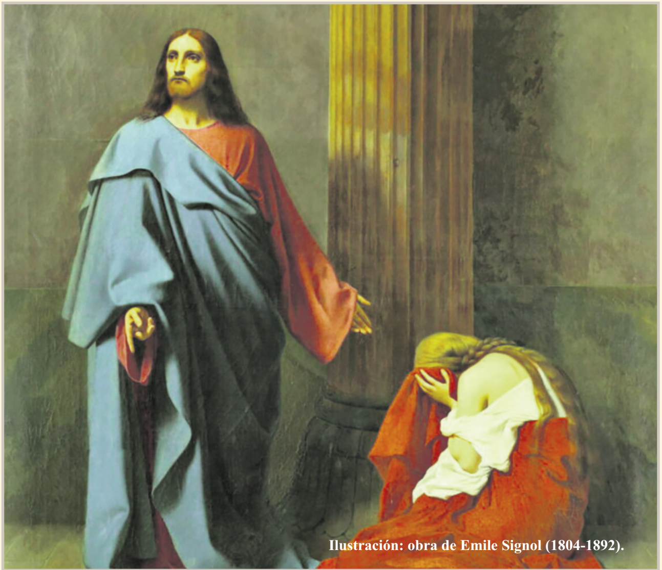
Ilustración: obra de Emile Signol (1804-1892).