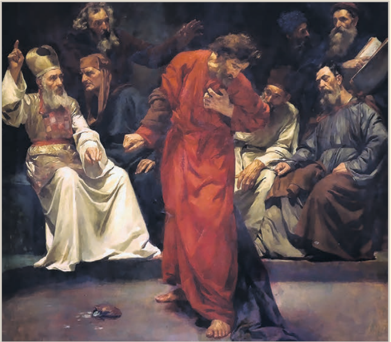
Ilustración: de la Semana Santa, sufrimientos de la Pasión de Cristo. Judas repulsa las monedas de su traición.