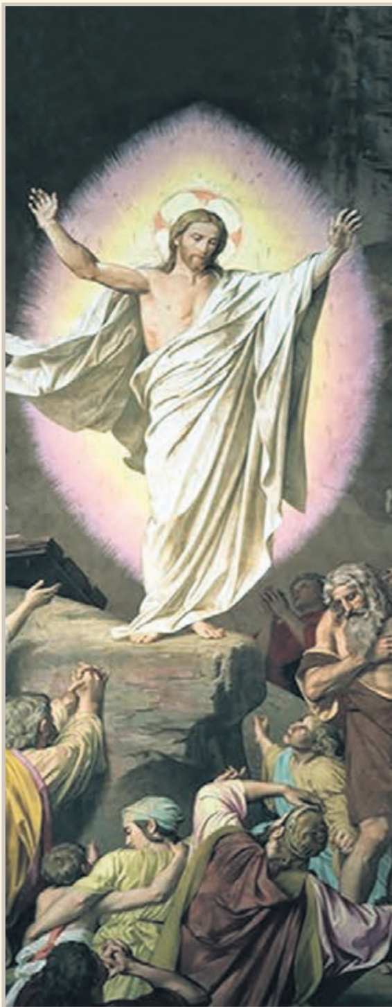
Ilustración: Nuestro Señor visita los infiernos, donde los justos esperan la Redención obrada por su Pasión, Muerte y Resurrección.