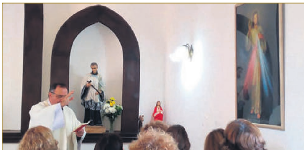
Distintos momentos de la ceremonia religiosa.

Fiesta de la Divina Misericordia. Dicho sacerdote es el párroco de la parroquia matriz, San Isidro Labrador. El mismo celebró la Misa ante la presencia de devotos, feligreses y autoridades civiles. A continuación, les compartimos parte de la reflexión