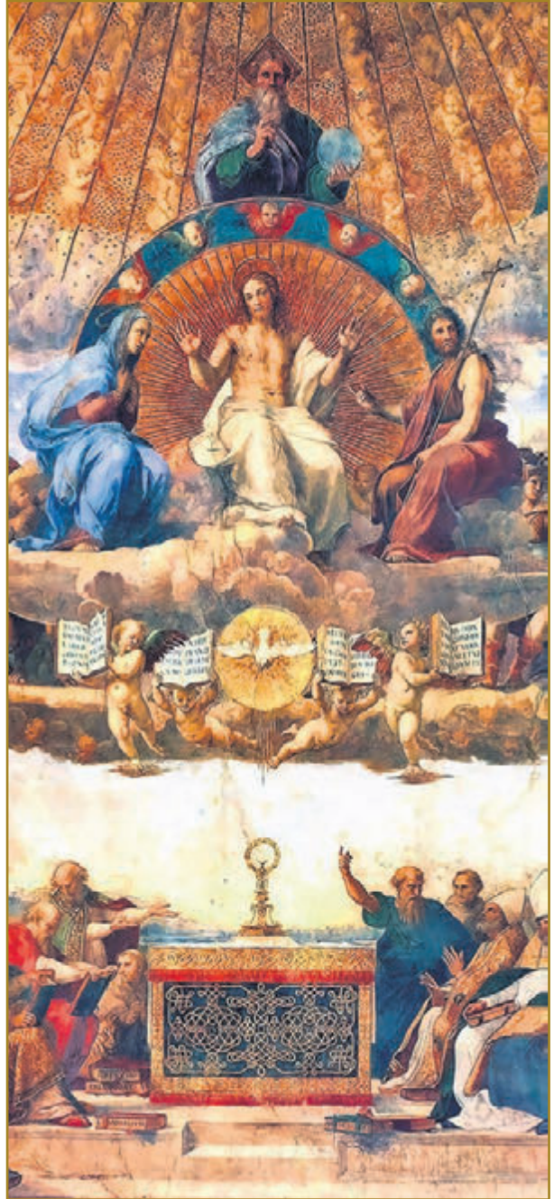
En la Santísima Eucaristía se nos concede la Comunión con toda la Santísima Trinidad.

Sigue, a estas palabras, el imprescindible recuerdo de la necesidad de una conciencia limpia para acercarse al Banquete eucarístico; disposición necesaria, que se prolonga, como consecuencia de un amor al que no se pueden poner límites ni encorsetar en mínimos de obligación, con la importancia, tan recordada en toda la tradición ascética y sacramental de la Iglesia, de la esmerada preparación interior para la Misa y la Comunión, de la devoción al comulgar, de la intensidad de la oración personal en esos momentos, etc. De ahí la enorme riqueza de consejos y recomendaciones, oraciones y devociones, en torno a la Misa, y sobre todo a la Comunión, que encontramos en la literatura espiritual cristiana.