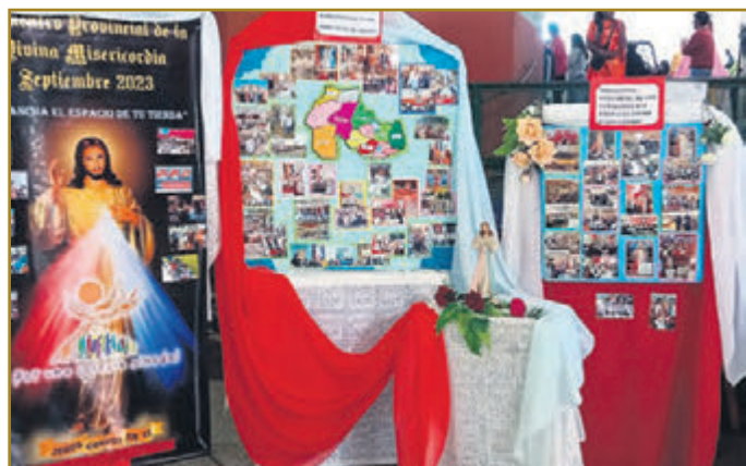
Stand "grupo Divina Misericordia" de Jujuy, en el Colegio San Alberto Magno de Río Blanco.

Por ello el obispo, sacerdotes y laicos estarán en la calle visitando todos los hogares llevando la palabra de Dios a las periferias. Y el "Grupo Divina Misericordia de la provincia de Jujuy" durante la semana de julio entregará material para difundir la devoción, como testimonio de nuestra Fe. (Romy Ramos)