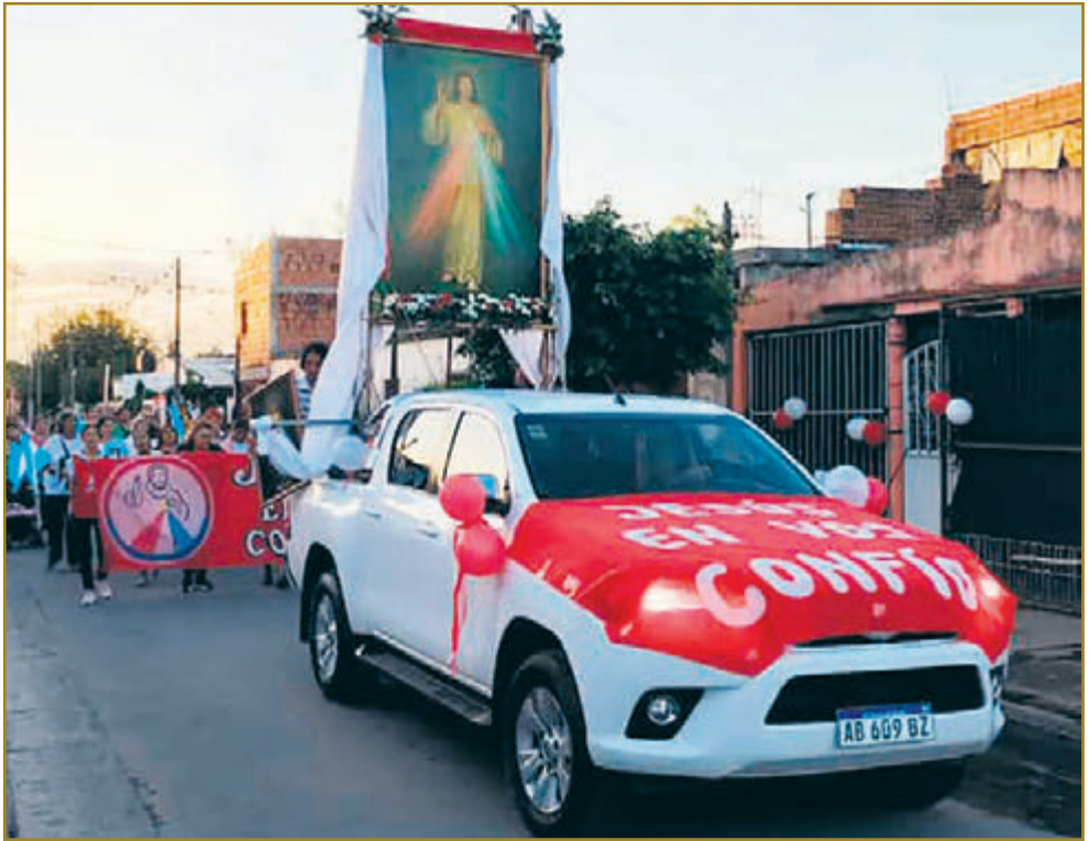
La procesión avanza por las calles de Ranchillos donde se iban sumando fieles.

En Ranchillos, localidad de Tucumán, los devotos vivieron con gran fervor el Domingo de la Misericordia participando de la novena, procesión y Santa Misa.