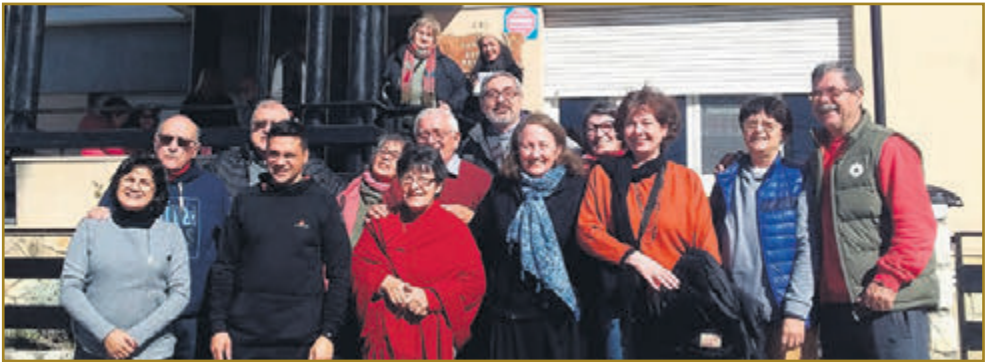
Distribuidores y difusores junto a los padres y autoridades de la Fundación soplan las velitas por los 30 años de Cristo Hoy .