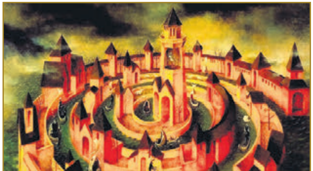
Santa Teresa escribió sobre esta presencia de Dios en el alma con la imagen de un castillo interior y de moradas.