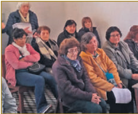
En la capilla y durante los ensayos antes de la Misa.