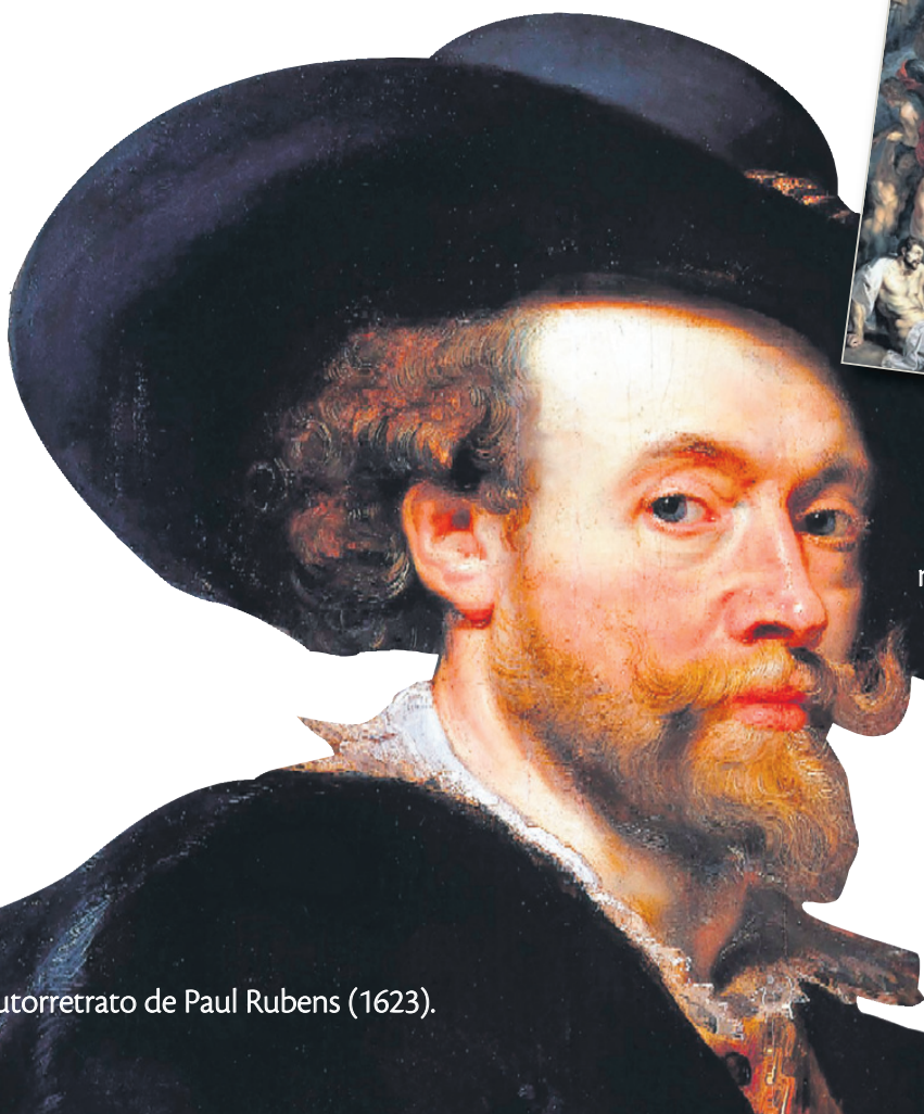
Autorretrato de Paul Rubens (1623).