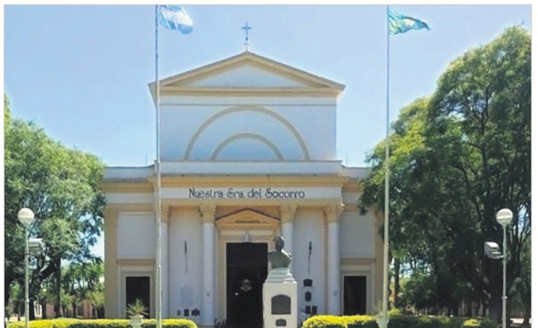
Nueva basílica menor, Nuestra Señora del Socorro en San Pedro (Bs. As.).

Mons. Hugo Santiago señaló durante el comunicado, que “el decreto Dumus Ecclesiae, del 9 de noviembre de 1989, explica el significado del mencionado título como una promoción e intensificación de los vínculos litúrgicos y pastorales de dicha basílica con la Iglesia de Roma y el Santo Padre”. Luego, el prelado precisó que la celebración de proclamación de la bula pontificia, la bendición de los signos físicos papales y la gran fiesta de inauguración de la basílica Nuestra Señora del Socorro se realizará el 8 de septiembre. (AICA)