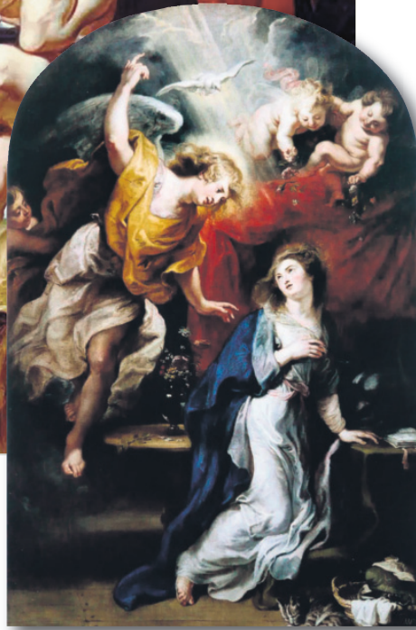
“La Anunciación”, se exhibe en la Rubenshuis, o Casa de Rubens, en Amberes (Bélgica).