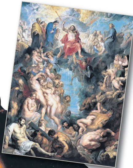
“El Juicio Final” se conserva en la Alte Pinakothek, un museo de Múnich (Alemania).

Ilustró numerosas escenas bíblicas, desde escenas clave del Antiguo Testamento hasta las horas de la agonía de Cristo. Sus cuadros más conocidos son La Erección de la Cruz (1610) y El Descendimiento de la Cruz (1611-1614), encargados para la catedral de Notre Dame de Amberes. También en esta catedral es llamativa la pintura del altar, donde mostró su gusto por los lienzos monumentales, reflejado en su obra La Asunción de la Virgen (1626).