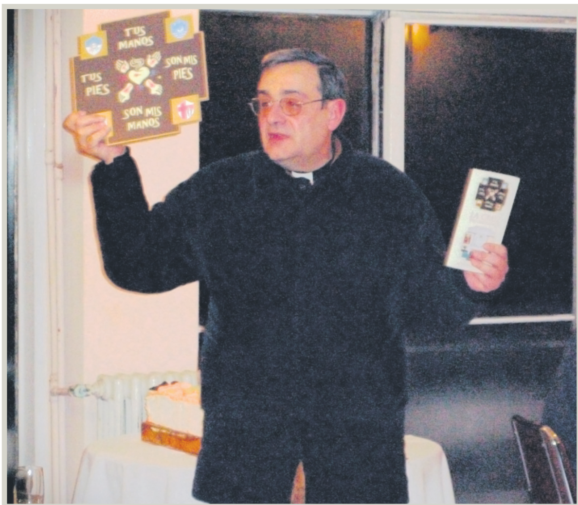
El padre Eduardo promoviendo la Cruz del Misionero a los difusores y distribuidores de Cristo Hoy en Casa Betania. La cruz misionera simboliza la tarea apostólica de la Fundación San José.

(Homilía de Cristo Hoy , edición 1057, Un solo camino).