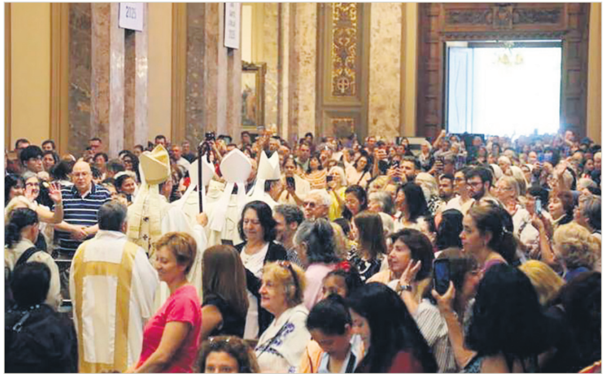
Inicio del Año Jubilar en Buenos Aires, con la catedral metropolitana (de la Santísima Trinidad) colmada de fieles.