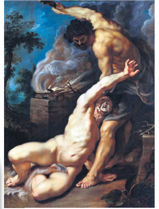
“Caín matando a Abel” se encuentra en el Instituto Courtauld de Londres.

Una gran parte de las obras del pintor flamenco Pierre Paul Rubens son de impronta católica, incluyendo muchos pasajes bíblicos tanto del Antiguo como del Nuevo Testamento. Esto le convierte probablemente en uno de los mejores ilustradores de la Biblia.