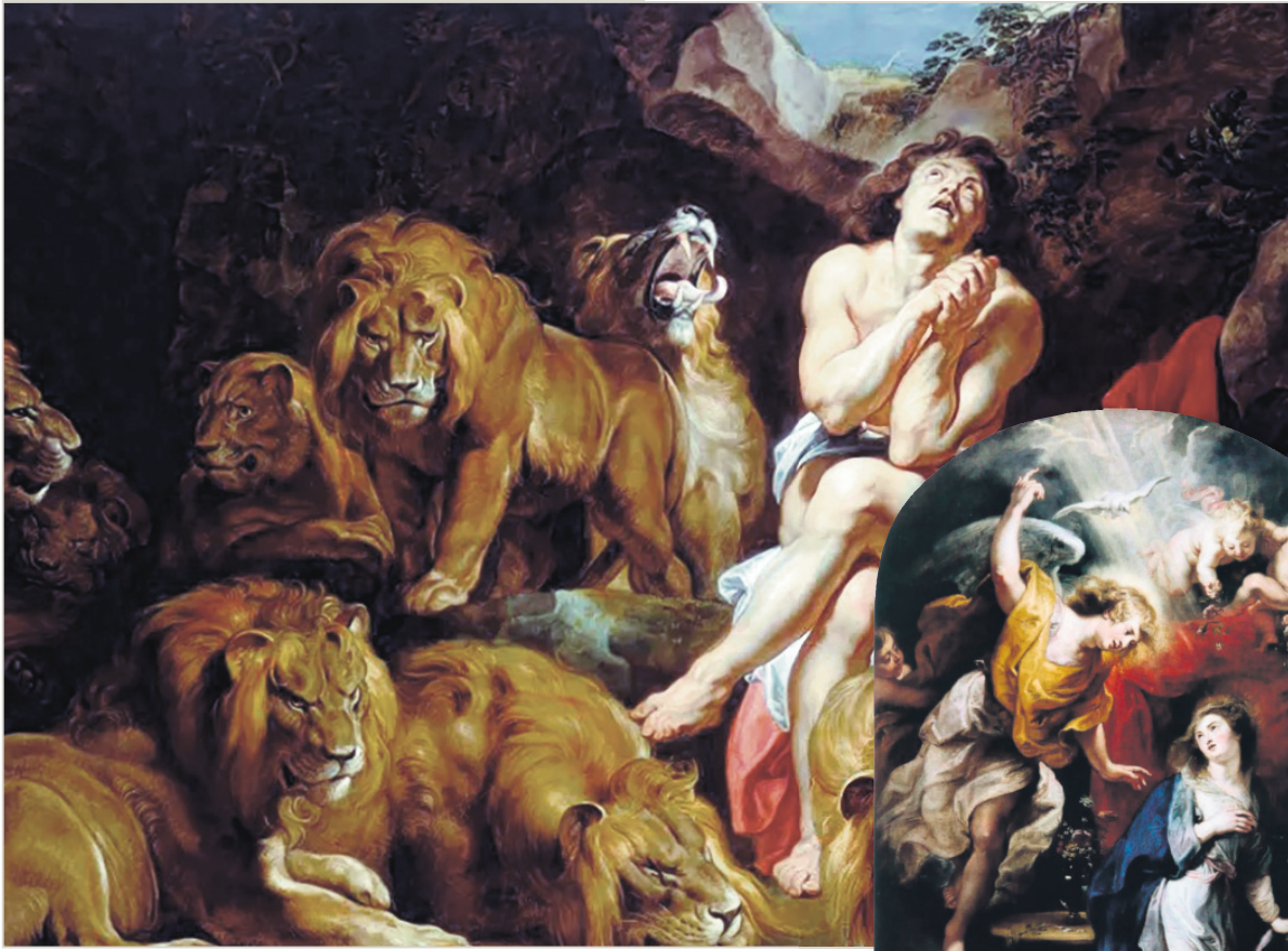
“Daniel, en el foso de los leones”, obra que se encuentra en la Galería Nacional de Arte en Washington, D.C., EE.UU.