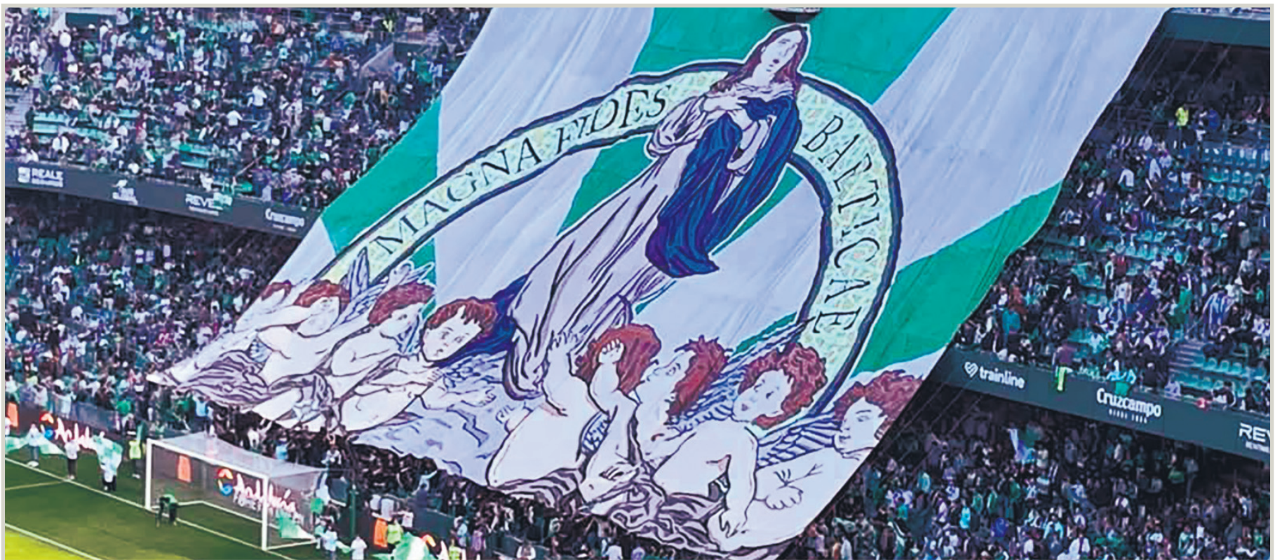
Imagen del mes: La hinchada del conjunto del Betis de Sevilla (España), desplegó durante su partido contra el Barcelona una bandera gigante con la Inmaculada Concepción para conmemorar la devoción mariana local durante su solemnidad el pasado 8 de diciembre.

Con Francisco: Santa Ángela de Foligno, Pedro Fabro (2013); José de Anchieta, María de la Encarnación y Francisco de Laval (2014); José Vaz, Junípero Serra (2015); Bartolomé de Braga (2019), Margarita de Città di Castello (2021) y, por último, las santas Mártires de Compiègne cuyo anuncio fue el 3 de marzo de 2022 y el 18 de diciembre del 2024 el decreto definitivo.