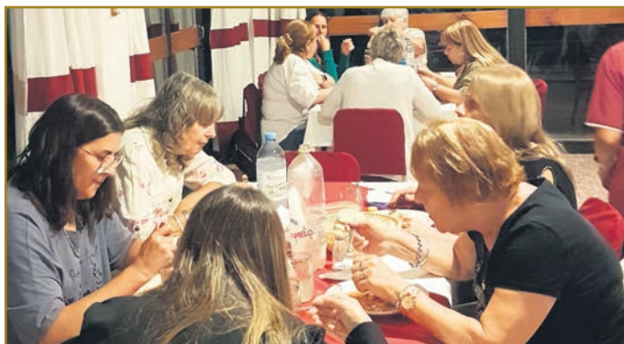
¡Infaltables! el grupo de Chacabuco, Buenos Aires, durante una de las cenas en el comedor.