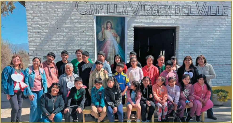
La finalidad es que los chicos puedan ver y comprender la misericordia en la Imagen de Jesús Misericordioso.

misión, la devoción a la Imagen de Jesús Misericordioso y la enseñanza de la Coronilla, para que los chicos puedan ver y comprender la misericordia en la Imagen de Jesús Misericordioso.