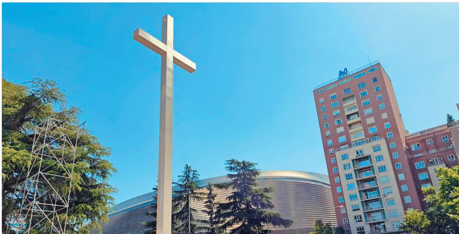
Foto del mes: Se instaló una gran cruz en la Plaza de Lima, España, frente al estadio del Real Madrid, escenario que el papa León XIV visitó en junio para estar con los jóvenes durante la vigilia. Al cierre de esta edición aún el Papa no había viajado a España.

En la tapa de esta edición hay dos imágenes del Papa, una es una foto (izq.), la otra imagen está armada por la IA.