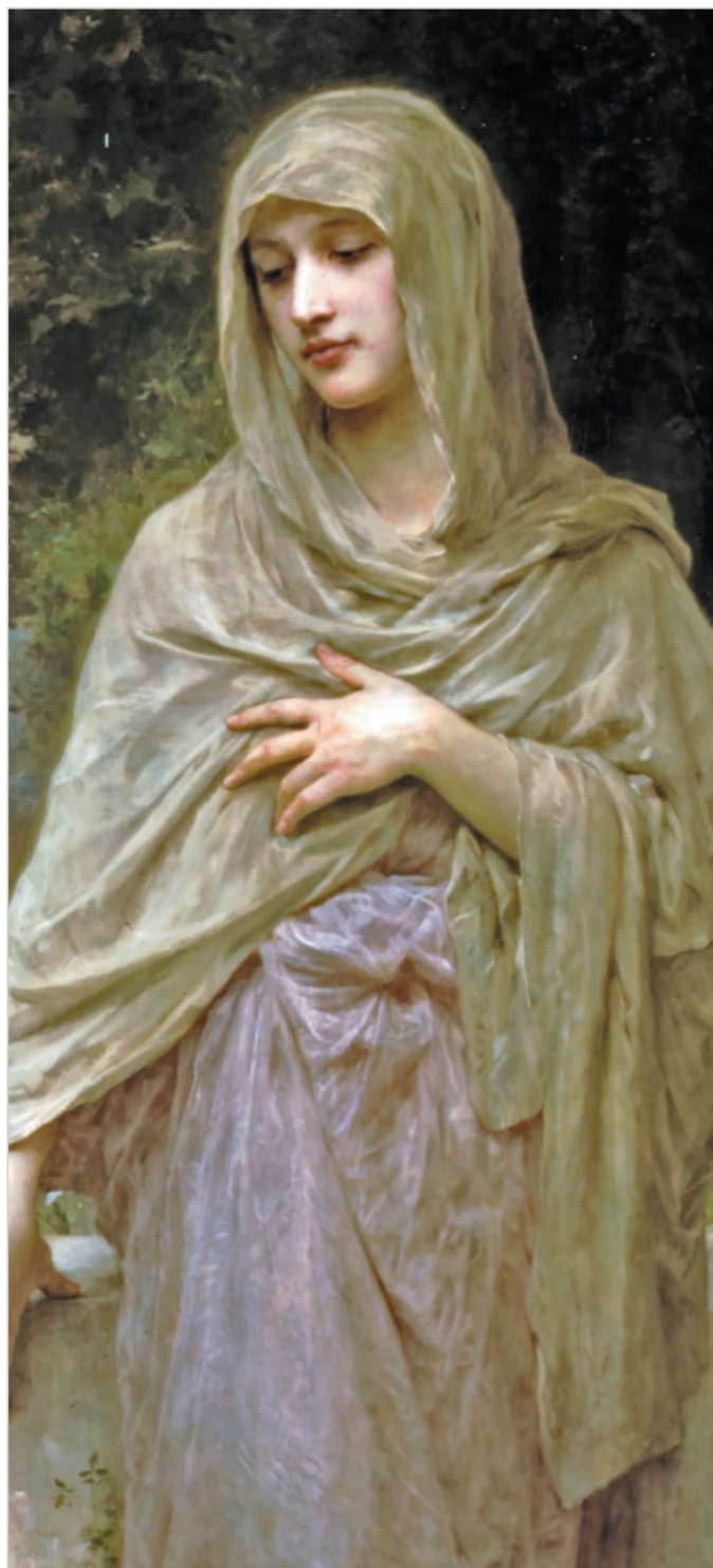
Modestia. Óleo sobre lienzo de 1902 del pintor francés William Adolphe Bouguereau.

La función de la vestimenta es ante todo la de velar el misterio del cuerpo, el cual es sagrado por ser el templo donde Dios habita. En honor a santa María Goretti, mártir de la pureza, dedicamos estas reflexiones.