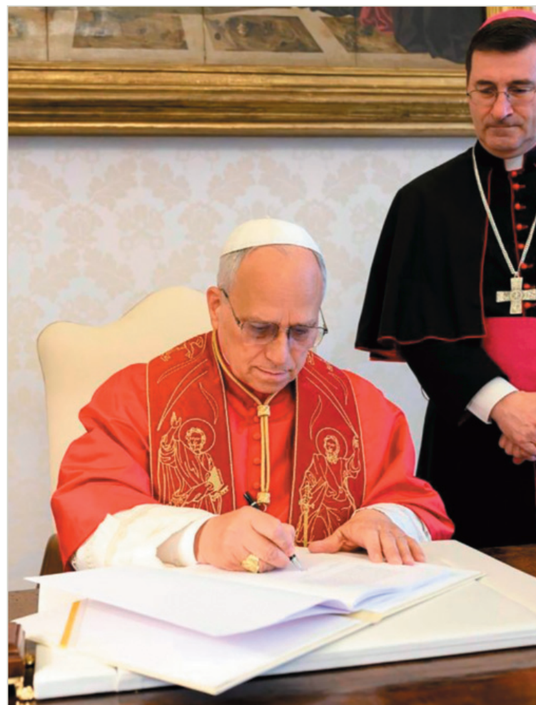
El papa León XIV en la firma de la carta encíclica Magnífica humanitas, 15 de mayo 2026.

“La velocidad y la sencillez con la que es posible obtener indicaciones [...] pueden [debilitar] el juicio personal y la creatividad”.